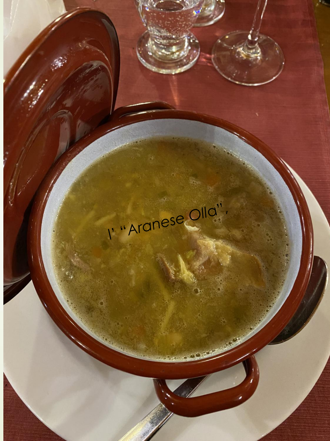
l' "Aranese Olla",