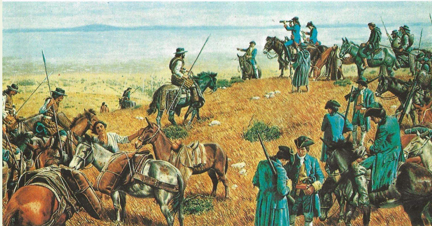
THE DISCOVERY OF SAN FRANCISCO BAY by the PORTOLÀ EXPEDITION