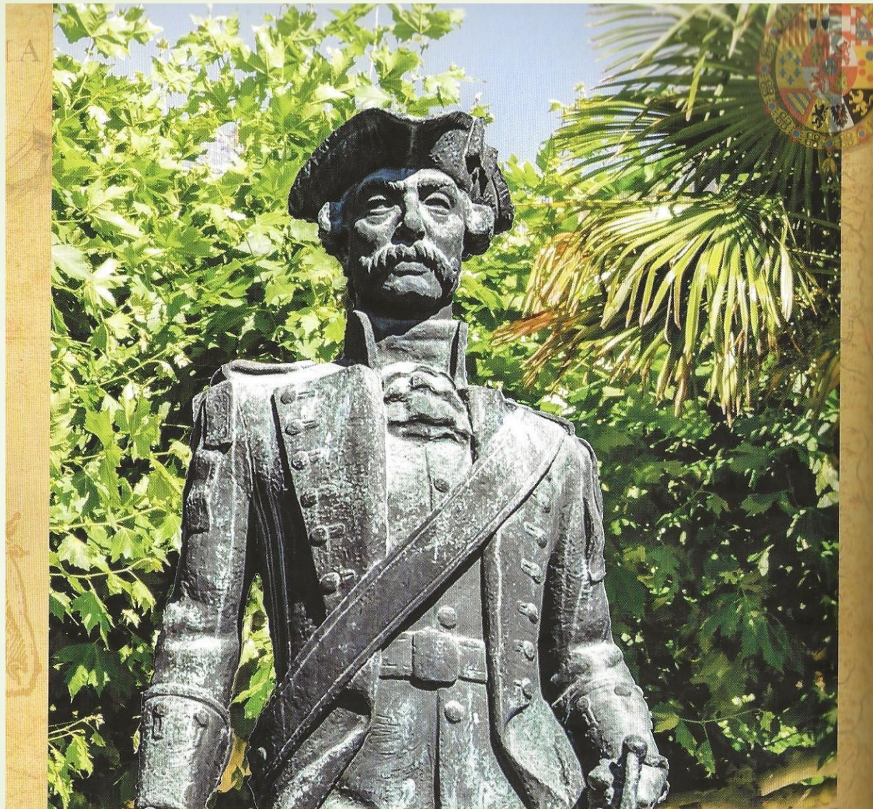
Retrato imaginario de Gaspar de Portola. Balaguer. Plaza de Pau Casals.